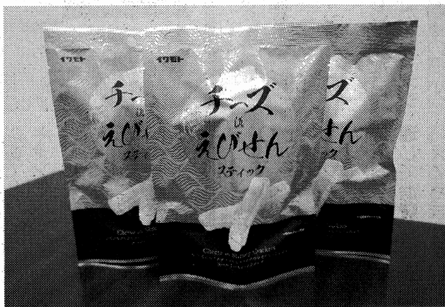
新製品「チーズいんえびせんスティック」

菓子製造販売の菓本製菓(本社稲沢市日下部北町4の5、森清次社長、電話0587・32・5138)は、焼き菓子の新製品「チーズいんえびせんスティック」を市場投入した。ウエハース製造のノウハウを活用して、チーズクリームをえびせんべいで挟み、軽い口当たりの焼き菓子に仕上げた。こだわりの原料による高級感で差別化し、大人向けスナックとしてアピールする。高級食品を取り扱うスーパーや専門店、自社オンラインショップで販売展開していく。(稲沢・堀田義博)